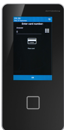
KABA TERMINAL 96 00

Dialogen läggs upp i ProMark och speglar därför företagets eget språk och termer. Den kan hanteras per medarbetarkategori för optimal datainsamling.