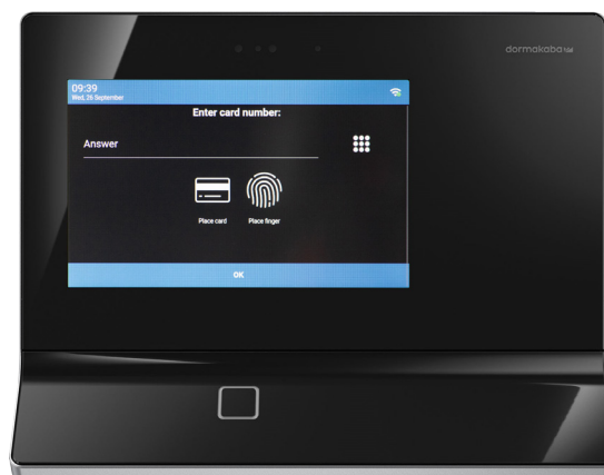
KABA TERMINAL 97 00