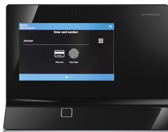
KABA TERMINAL 97 00